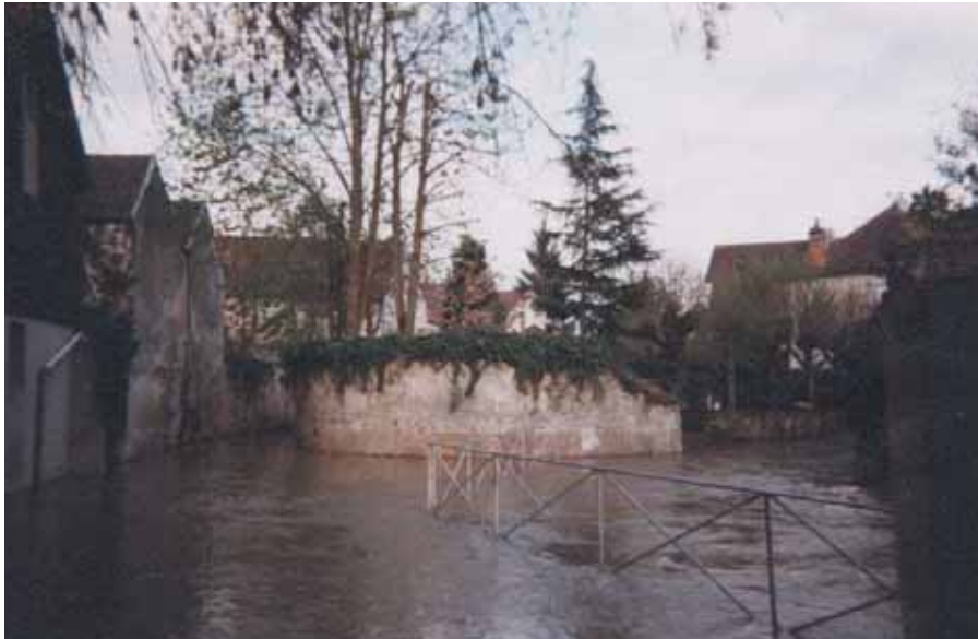
Crécy-la-Chapelle – inondations avril 1999

La catastrophe est imminente lorsque la précédente n'est plus dans les esprits